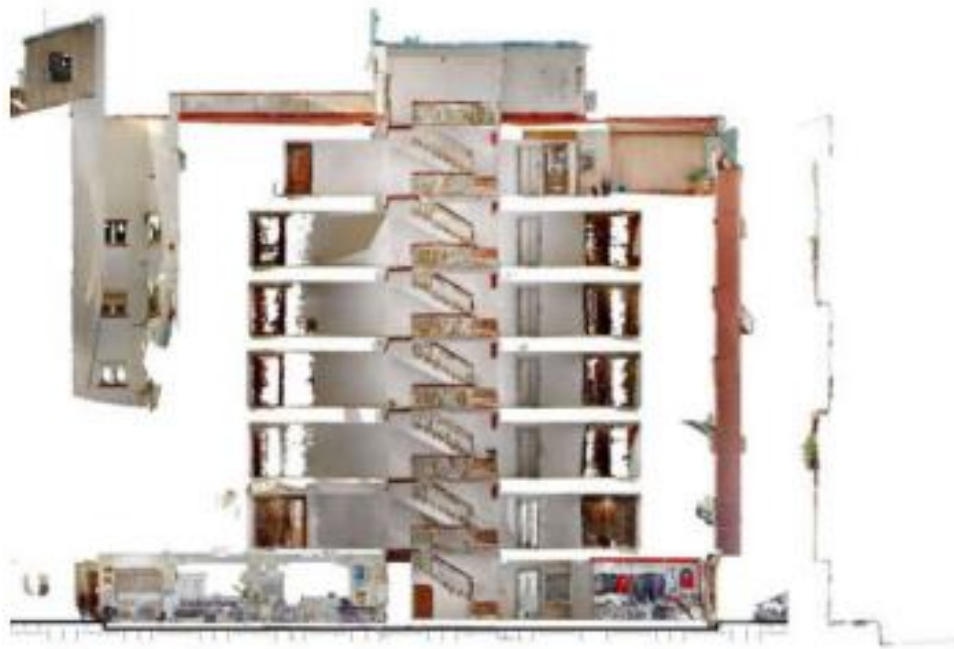
Modelado del edificio con nube de puntos