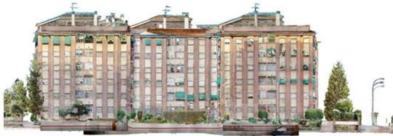
Modelado del edificio con nube de puntos